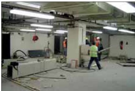
Kryt CO se přebuduje na centrální serverovnu a centrální šatny pro zaměstnance.

Před nedávnem, 1. října, začala rekonstrukce Traumatologického centra a urgentního příjmu a dále výstavba nového oddělení centrální sterilizace - v bývalém skladu SZM a přilehlých prostorách. Pokud bychom přistoupili k rekonstrukci stávající centrální sterilizace, museli bychom její provoz odstatit nejméně na 4 měsíce a zabezpečovat jej prostřednictvím jiných nemocnic, což by se dost dražilo. Chtěl bych proto v této souvislosti velmi ocenit současné řešení, které navrhla Jana Šafránková, zástupkyně vrchní sestry Oddělení centrální sterilizace.