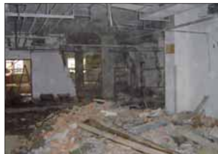
V bývalých prostorách části odboru zásobování se buduje nové oddělení centrální sterilizace...