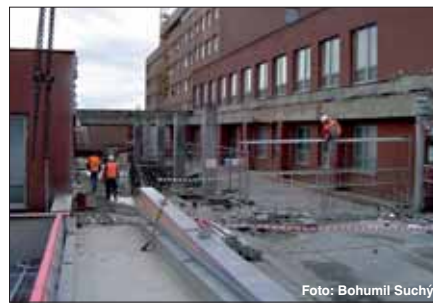
Rekonstrukce urgentního příjmu a traumatologického centra probíhá za plného provozu...