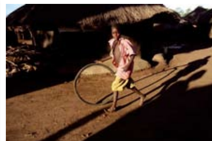
DĚTSTÍ VOJÁČI (Uganda, 2007) Za posledních 20 let bylo uneseno přes 20 000 dětí, ze kterých rebelové z Armády Božího odporu udělali dětské vojáky. Proto rodiče posílali své děti do nocleháren ve městech. Po uzavření příměří se situace uklidnila a tak dnes již dětské noclehárny nejsou potřebné.