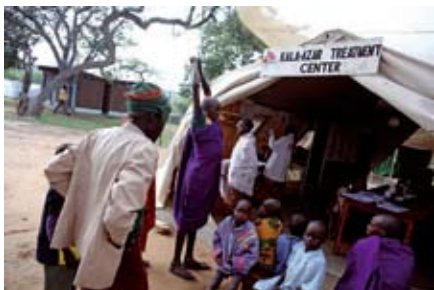
NEMOCNICE V KACHELIBĚ (Keňa, 2007) V programu bylo od jeho otevření v únoru 2007 až do poloviny září léčeno 675 pacientů s kalaazarem. Většina nemocných je po dobu trvání léčby hospitalizovaná, ovšem pacienti, kteří žijí v dostupné vzdálenosti a jejich zdravotní stav to dovoluje, přicházejí každé ráno na injekce a kontrolu.

Ve středu 28. ledna se uskutečnila v Galerii Ametyst vernisáž ojedinělé výstavy fotografií nazvané Zapomenuté světy. Výstavu připravili Lékaři bez hranic ve spolupráci s fotografem Janem Šibíkem.