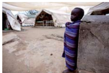
BUDOUCNOST LÉČBY (Keňa, 2007) Aby se život zachraňující léčba dostala k většímu množství lidí, je třeba snížit cenu léků, častěji vyrábět jejich generické verze, zintenzivnit výzkum a vývoj nových kombinací léků a diagnostických metod a v neposlední řadě na mezinárodní úrovni efektivněji reagovat na propukající epidemie.

nemoci v polních podmínkách a život obyvatel v oblasti Západní Pokot. Série je doplněna záběry ze života v uprchlickém táboře v severní Ugandě. Dvacetiletá válka, v níž na severu Ugandy proti vládním jednotkám bojovali rebelové z Armády Božího odporu, přinutila 1,6 milionu lidí opustit domovy a přežít v těžkých podmínkách uprch-