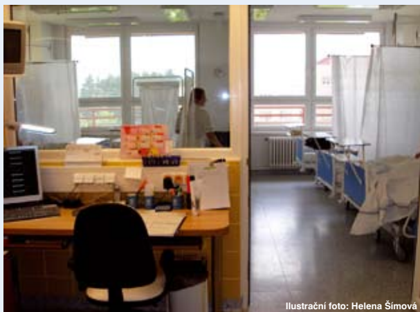
Ilustrační foto: Helena Šimová

Tržby od zdravotních pojišťoven představovaly cca. 80 % veškerých příjmů nemocnice.