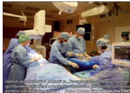
Jedním ze schválených projektů je „Transplantace autologních kmenových buněk kostní dřeně u pacientů s chronickou kritickou končetinovou ischemií a diabetickou nohou“.

Pro letošní rok jsme získali účelovou podporu IGA MZ ČR a dotace z rozpočtu MSK na