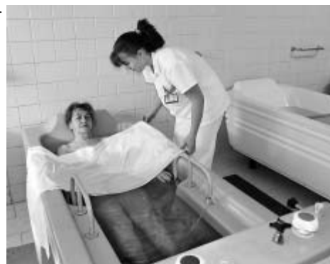
Pacienti mají k dispozici také vodoléčbu.

„Předpisy systému jakosti uvádíme do provozu postupně, tak jak jsou schvalovány, jejich dodržování je průběžně kontrolováno. V léčebně pravidelně sledujeme i jednotlivé ukazatele – například průměrnou dobu hospitalizace, řešení sociální situace a podobně.“ (šim)