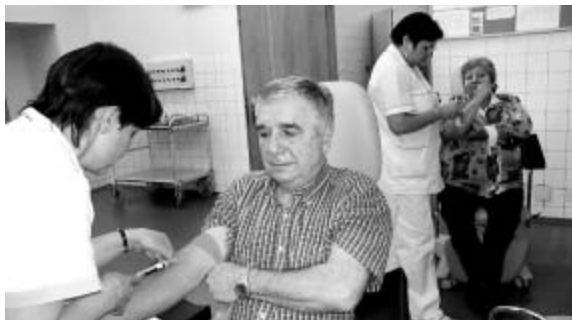
Odběry provádějí erudované sestry.

Chtěla bych poděkovat všem pracovníkům, kteří se podíleli na vybudování tohoto prac-