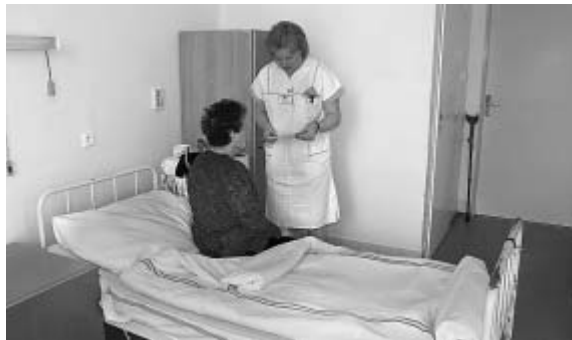
Menší pokoje zajišťují pacientům více soukromí.

V Léčebně pro dlouhodobě nemocné Klokočov jsou od 1. března onkologicky nemocní pacienti soustředěni v samostatném oddělení a starají se o ně dva onkologicky erudovaní lékaři.