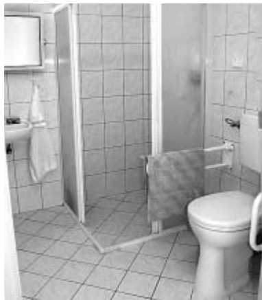
Pokoje mají i moderně vybavené příslušenství.

Léčebna v Klokočově beze zbytku plní požadavky fakultní nemocnice na hospitaliza-