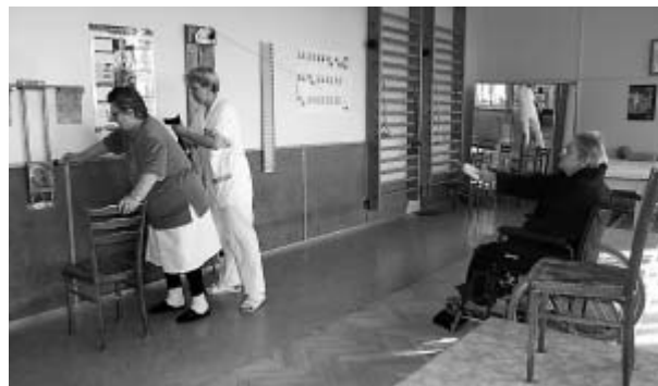
Nezbytnou součástí léčebny je tělocvična.

ce pacientů. Osvědčilo se i předem dojednané zjednodušené odesílání pacientů.