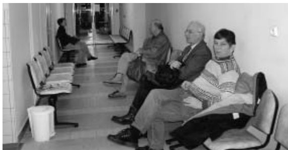
V čekárně nového odběrového centra.

Dobešové, náměstkyně pro ošetrovatelskou péči. „Se zřízením odběrového centra se počítalo