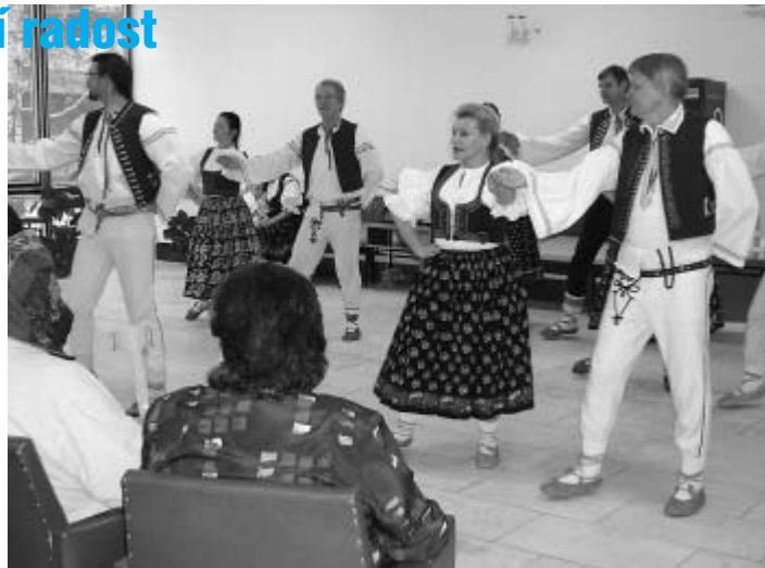
Folklorní taneční soubor Kotek si získal srdce diváků...

Na závěr bych snad ještě chtěla dodat svou osobní zkušenost. Organizace koncertů na klinice mne přesvědčila, že je u nás ještě pořád hodně lidí, kteří jsou ochotni ve svém volném čase